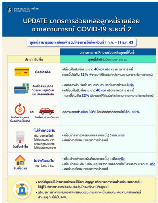
Infographic ตามมาตรการในข่าวข้อที่ 3